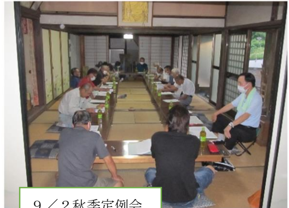
9 / 2 秋季定例会