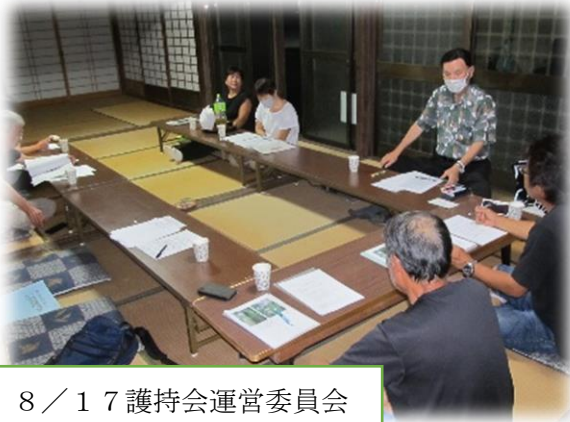
8 / 17 護持会運営委員会