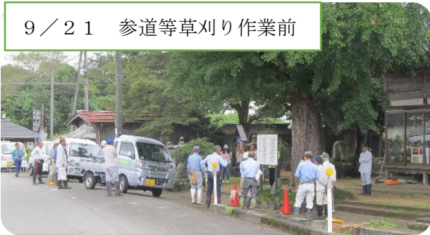
9 / 21 参道等草刈り作業前