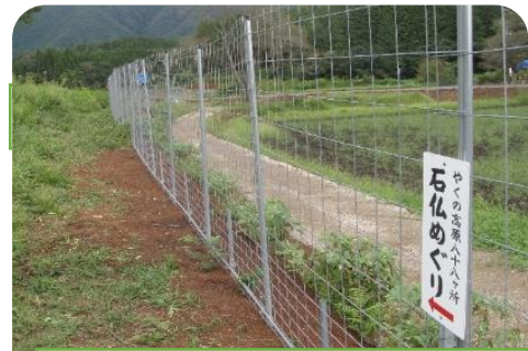
9 / 21 新しい巡拝道の下見