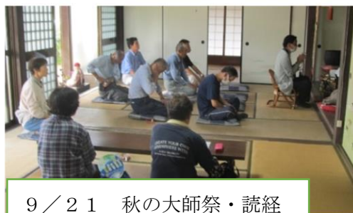
9 / 21 秋の大師祭・読経